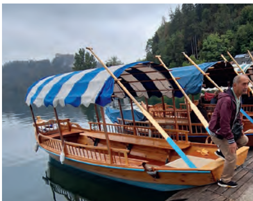
Mit einer Pletna, einem traditionellen Holzboot, ging es auf die Insel im Bleder See mit der Kirche Mariä Himmelfahrt. Rechts daneben die Türe der St.-Nikolaus-Kirche in Laibach.

Anschließend ging es zur größten Höhlenburg der Welt in Predjama. Dort erwischte uns leider ein