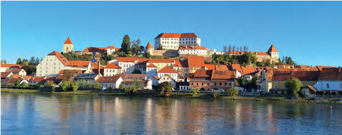
Blick auf Burg und Altstadt von Ptuj, der ältesten Stadt des ehemaligen Herzogtums Steiermark.

Regenguss, ehe wir über die Zugbrücke ins Innere der Burg flüchten konnten. Nun ging es treppauf und treppab. Wir erfuhren vom Schicksal des Ritters Erasmus und seinem Tod durch eine Kanonenkugel auf dem Burgklosett.