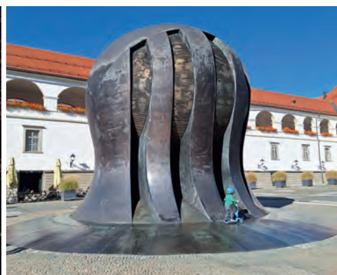
Die Drachenbrücke in Laibach, die Adelsberger Grotte und das 1975 errichtete Bronzedenkmal NOB in Marburg, das an die 667 Widerstandskämpfer:innen im Zweiten Weltkrieg erinnert. (v.l.n.r.)